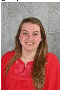
Pien Does groep 1-2c