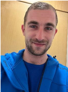
Boy Kok vakleerkracht gym SRO